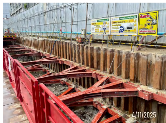
รูปที่ 1.5-1 สถานะของโครงการเดือนกรกฎาคม – ธันวาคม 2568